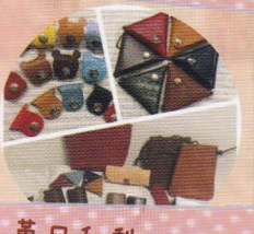
草日和梨 (草、布小物作家)