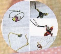
みらい (アクセサリー作家)