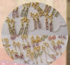
.merry (レジンアクセサリー作家)