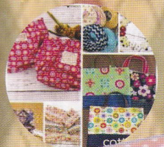
cottorin (布小物ハンドメイド作家)