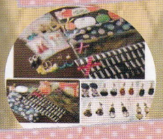
daisy&MY (アクセサリー・布小物作家)