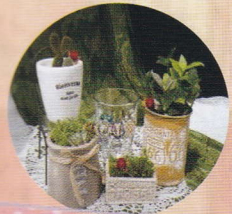
35☆キラHM (アクセサリー作家)