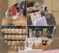
natural merci (ドリンク・かき氷・アクセサリー)