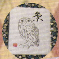
HISTORY (書道・絵画・アクセサリー)