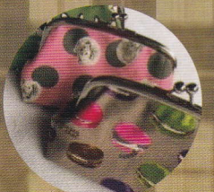
SORA 豆 (かまロバッグ・ アクセサリー作家)