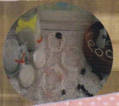
amazingterrace (ハンドメイド作家)