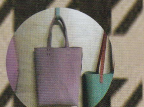
ハンドメイド雑貨 ほろ38ベロ (アクセサリー・布小物)