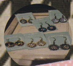
milkycotton (アクセサリー作家)