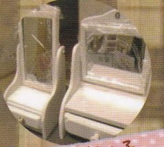
工房 杉の子 (木工作家)