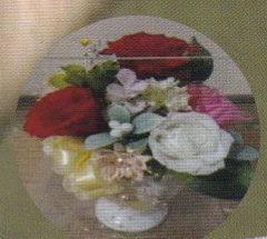
ひろひろ (ブリザーブドフラワー作家)