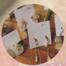
紅桜 (アクセサリー作家)