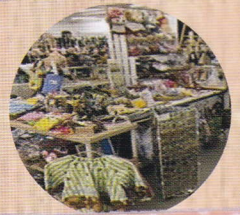
アブリ雑貨のお店 う・さ・ぎ (布・お人形の服他等の手作り作家)