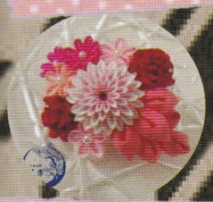
つまみ屋 華季 (つまみ細工作家)