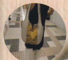
ichigo-ichie (パッチワーク・ナチュラル 布子物・洋服作家)