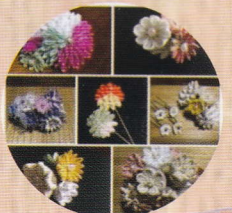
ころさんのおもち箱 (つまみ細工・布小物作家)