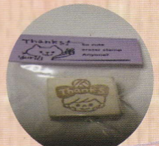
消しゴムはんこyuri (消しゴムはんこ)